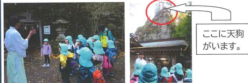
ここに天狗がいます。

高住神社には、天狗やカラス天狗などが祭られています。子どもたちは、迫力のある天狗をしっかり見ていましたよ。そして、神社の方に英彦山のお話をいただきました。高住神社のそばにある崖を見上げると、そこにも天狗が…。高住神社に行く機会がありましたら、ぜひ見つけてみてください。